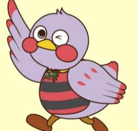
埼玉県のマスコット さいたまっち