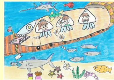
参考：前回入賞作品