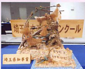
小学生低学年の部